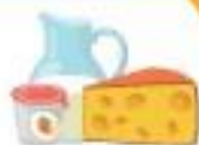
МОЛОКО, ЙОГУРТ И СЫР