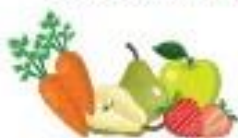
ФРУКТЫ И ОВОЩИ