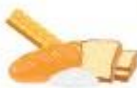
ХЛЕБ, ЗЛАКИ, МАКАРОНЫ И РИС